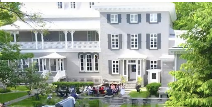
Retraite Mastermind, Juin 2022

Bien sûr, la COVID-19 modifie profondément le fonctionnement d'Avego Académie, qui organise alors ses événements en virtuel. Le concept fonctionne globalement bien, même si l'énergie n'est plus tout à fait aussi intense que lors des rassemblements en personne.