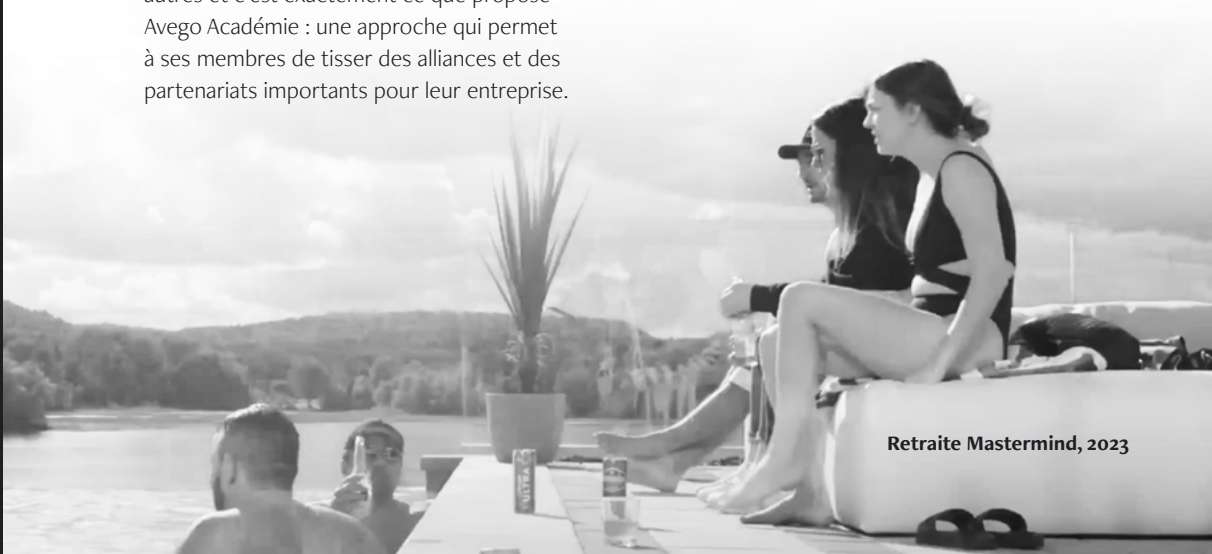
Retraite Mastermind, 2023