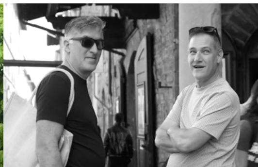
Retraite Mastermind, Italie 2022

Il faut en effet un bon contexte pour favoriser l'échange et l'ouverture des uns aux autres et c'est exactement ce que propose Avego Académie : une approche qui permet à ses membres de tisser des alliances et des partenariats importants pour leur entreprise.