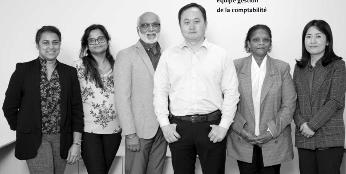
Équipe gestion de la comptabilité

Certaines chaînes annulent même des ententes avec des distributeurs mondiaux pour faire affaire avec GB Micro, parce qu'elles ont la certitude de voir tous leurs besoins comblés au bon moment. Elles apprécient particulièrement que GB Micro effectue une gestion très efficace de ses inventaires.