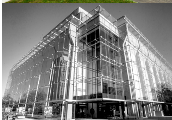
Grand Théâtre de Québec