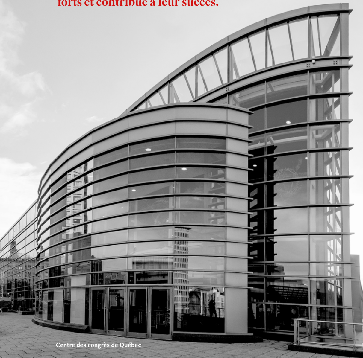
Centre des congrès de Québec

Si c'était à refaire pourtant, ils ne changeraient rien. Chaque épreuve les rend plus forts et contribue à leur succès.