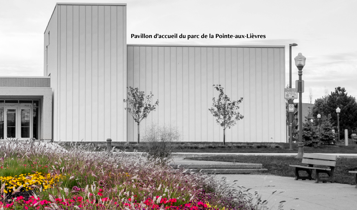
Pavillon d'accueil du parc de la Pointe-aux-Lièvres