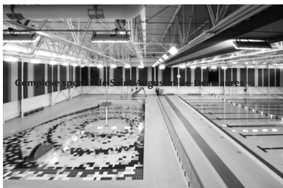
Complexe sportif de Saint-Augustin-de-Desmaures