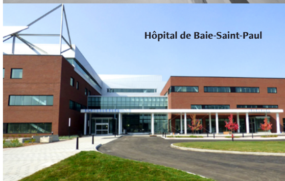
Hôpital de Baie-Saint-Paul